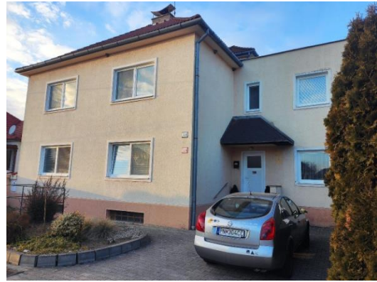
Rodinný dom v obci Trebatice