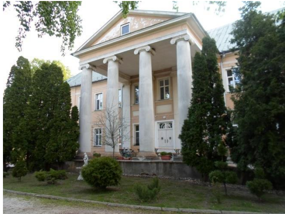
Kaštieľ v obci Pečeňady