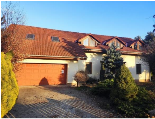
Rodinný dom v obci Veselé