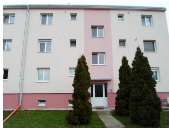
Bytový dom v obci Veľké Kostofany