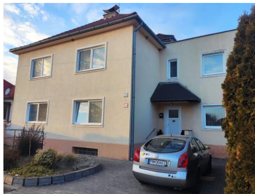
Rodinný dom v obci Trebatice