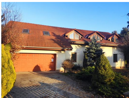
Rodinný dom v obci Veselé