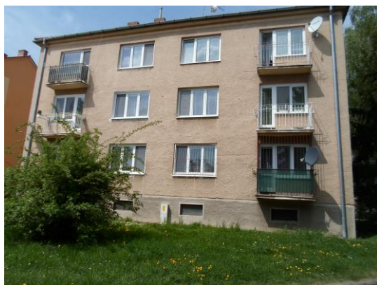
Bytový dom v Piešťanoch