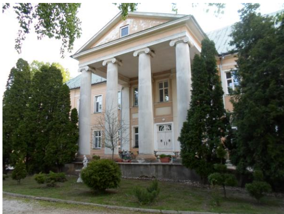
Kaštieľ v obci Pečeňady